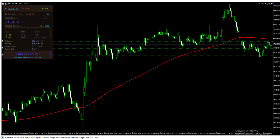
ภาพที่ 1 — Panel DualSide EA บนกราฟ

เมื่อรัน EA จะมี Panel แสดงสถานะ real-time บนกราฟ